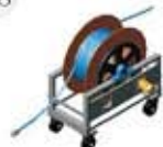
HSR-W1800 (Max.1800bar) 盘管器(液压驱动)