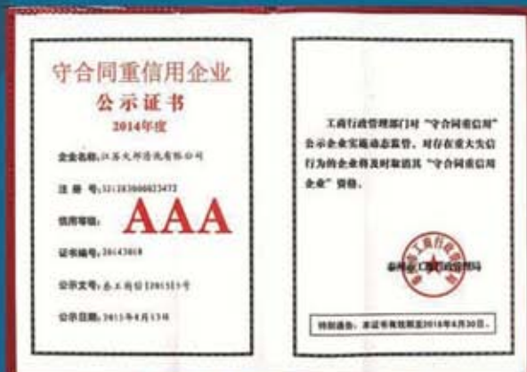
守合同重信用 3A 证书