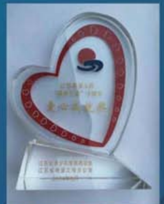
青少年发展基金会