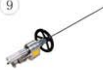
RSG300/30 (Max.3000bar) 气动旋转枪