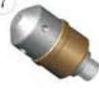
RWT-F15M (Max.1500bar) 管道清洗自旋转喷头